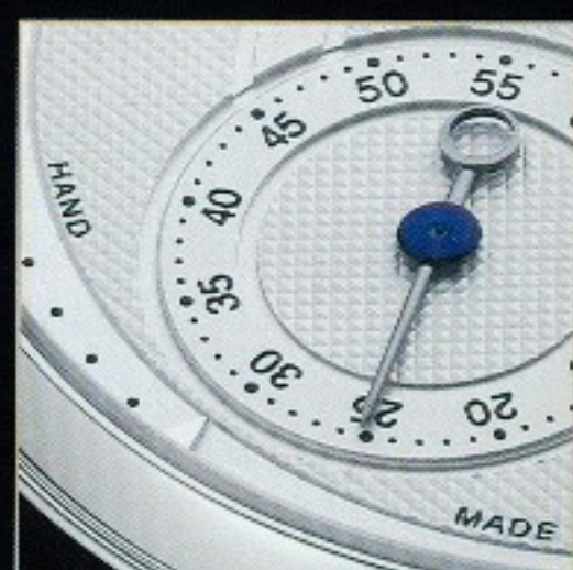
Mehanizem ure Voutilainen Observatoire (levo) in detajl z njegove številčnice

si še vedno zagotovijo kronometrski certifikat za natančnost. Voutilainen ponosno pokaže prefinjenosti mehanizma – kot zrcalo čiste ženevske črte na mostičkih, skrbno odrezane robove in pobeljene vijake,